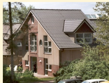
Haus Junge Lüüd (Klinikschule)

Aus Gründen der Hygiene bitten wir Sie, Ihrem Kind/Ihren Kindern in unserem Haus Hausschuhe, Socken o.ä. mitzugeben.