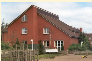
„Badehuus“ (Badehaus) Schulklassen: Asterix, Obelix, Idefix

Wichtig: Bitte schauen Sie regelmäßig, d.h. mindestens einmal täglich in Ihr Postfach , ob evtl. ein aktuell geänderter Terminplan vorhanden ist.